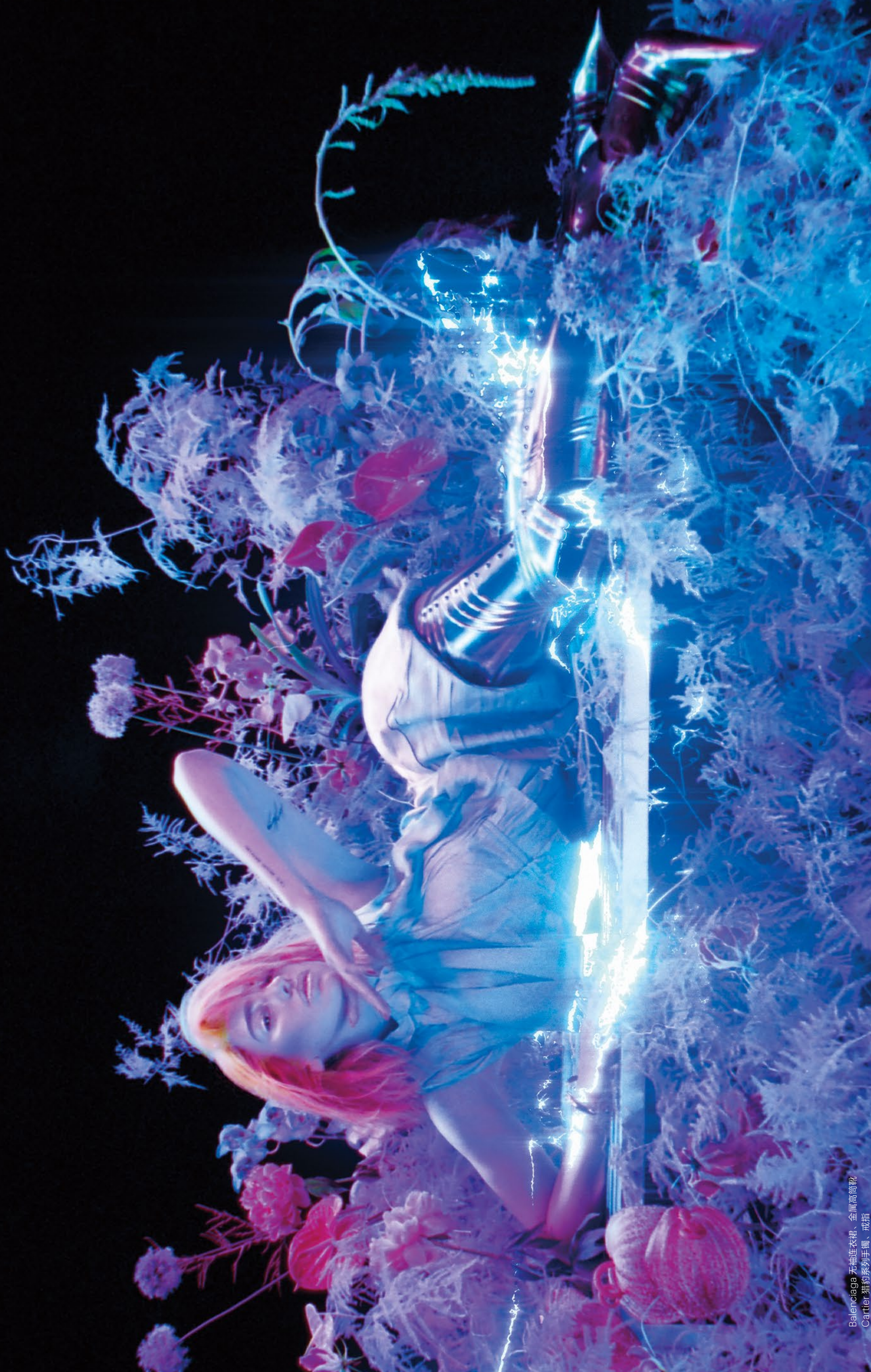
Balenciaga 无袖连衣裙、金属高筒靴 Cartier 猎豹系列手镯、戒指

“希望我们已经度过了最坏的时期，慢慢地我们会回到彼此拥抱、在人群中跳跃、在俱乐部中挥洒汗水的状态。这就是生活的美妙之处——人与人之间之间的联系。音乐是世界性的语言，让人们聚集在一起。”她总结道，脸庞上的桃红色闪粉熠熠生辉。（翻译：Shirley Tang）