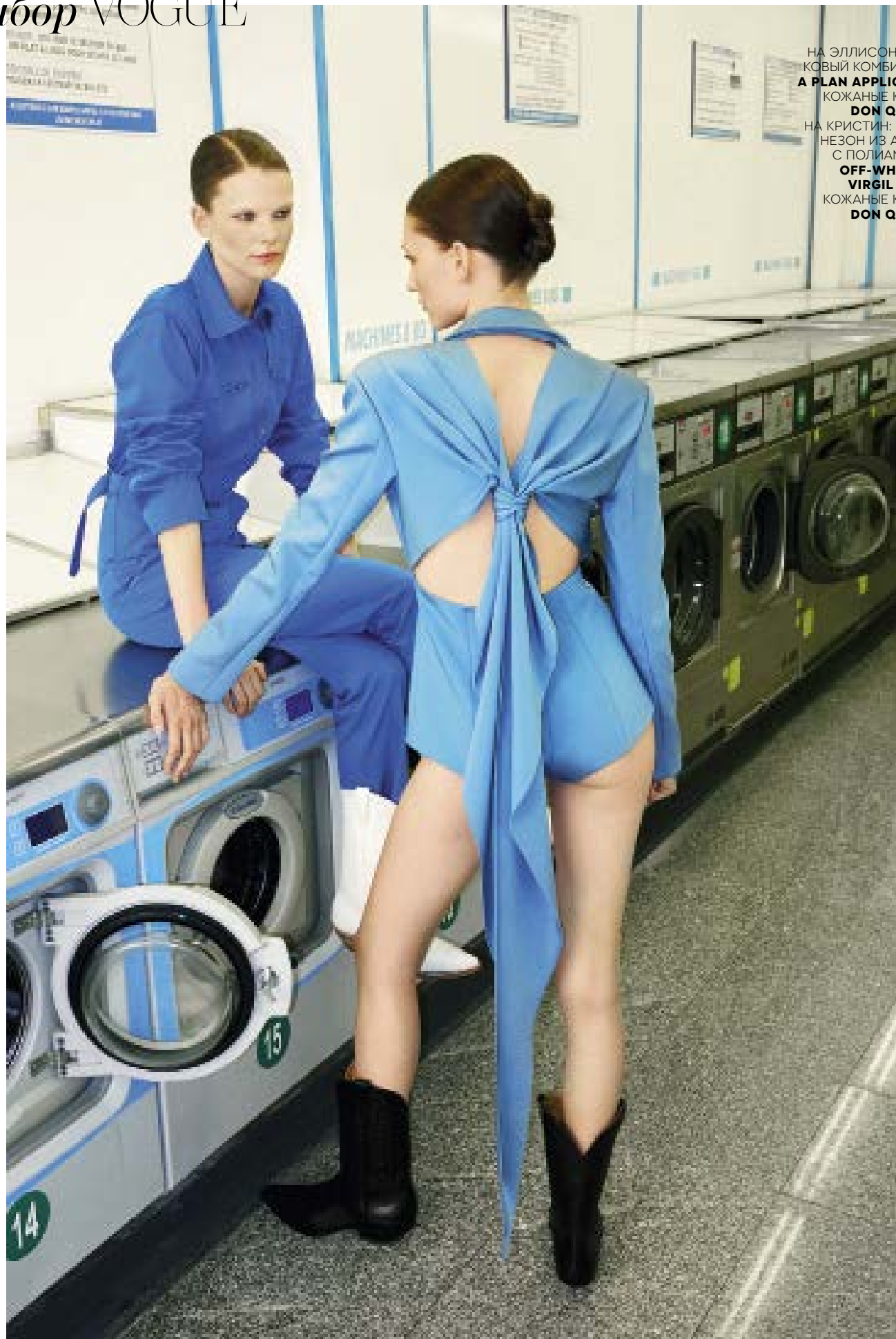
НА ЭЛЛИСОН: ХЛОП-КОВЫЙ КОМБИНЕЗОН, A PLAN APPLICATION; КОЖАНЫЕ КАЗАКИ, DON QUIJOTE НА КРИСТИН: КОМБИНЕЗОН ИЗ АЦЕТАТА С ПОЛИАМИДОМ, OFF-WHITE C/O VIRGIL ABLOH; КОЖАНЫЕ КАЗАКИ, DON QUIJOTE